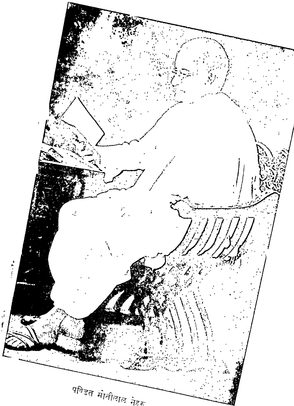
पण्डित मांतीलाल नेहरू.